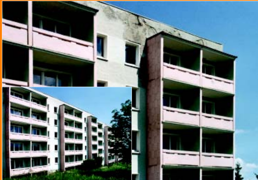
Noch in diesem Jahr wird der Rückbau des Wohnhauses Florian-Geyer-Straße 1–4 in Angriff genommen.