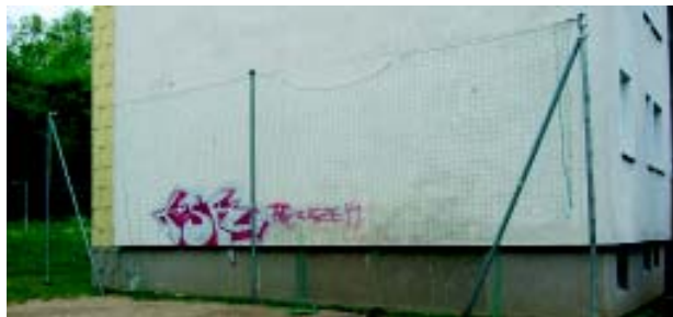
Das zerstörte Netz auf dem Bolzplatz